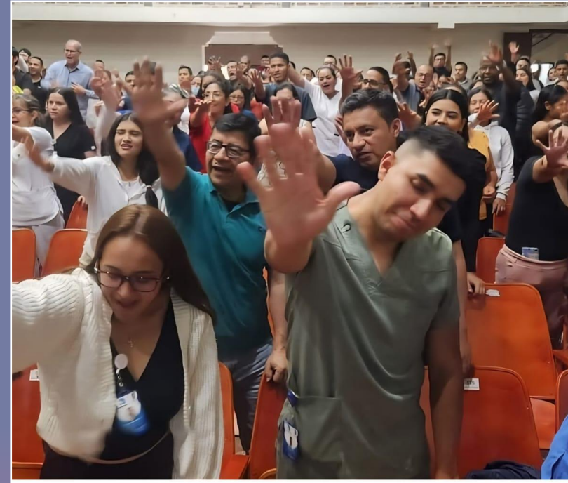
Momentos de auto cuidado